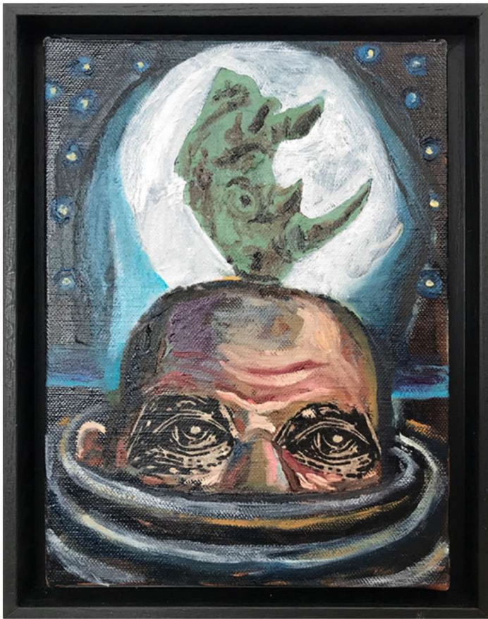
Damien DEROUBAIX Melancholia (Rhinocéros) , 2019 Huile et collage sur toile, 33 x 24 cm Courtesy l'artiste & Nosbaum Reding, Luxembourg