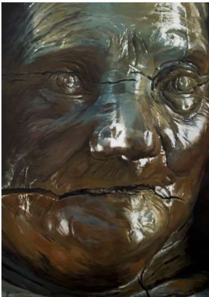
visuel / Damien Cadio

Painting Spirit#2 Les anneaux de Saturne commissariat Sylvie Coulon