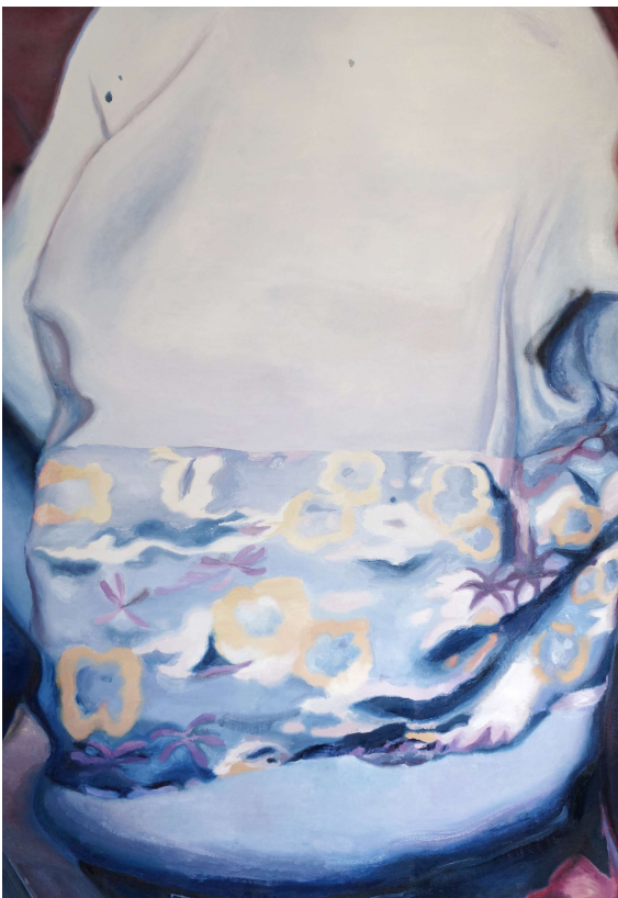
Mireille BLANC Motif , 2019 Huile sur toile, 180 x 124 cm

https://www.arte.tv/fr/videos/085905-004-A/mireille-blanc/