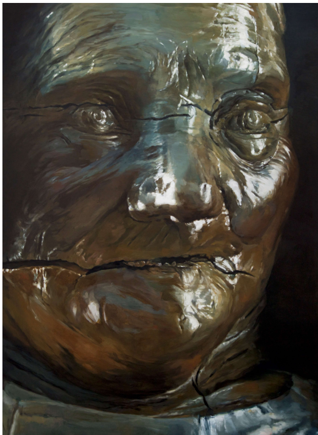
Damien CADIO Mladic, 2015 Huile sur toile, 160 x 115 cm