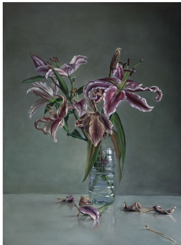
Damien CADIO Not all roses, 2017 Huile sur toile, 95 x 70 cm