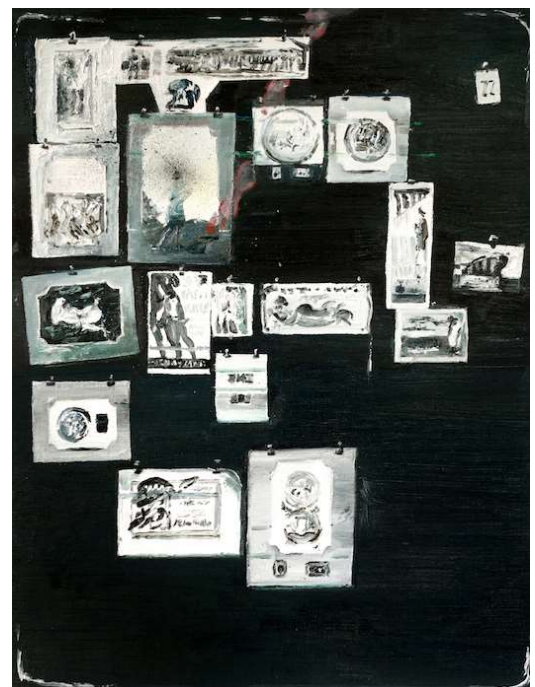
Mireille BLANC Planche 77 AW , 2017 Huile sur toile, 50 x 38 cm

https://www.arte.tv/fr/videos/085905-004-A/mireille-blanc/