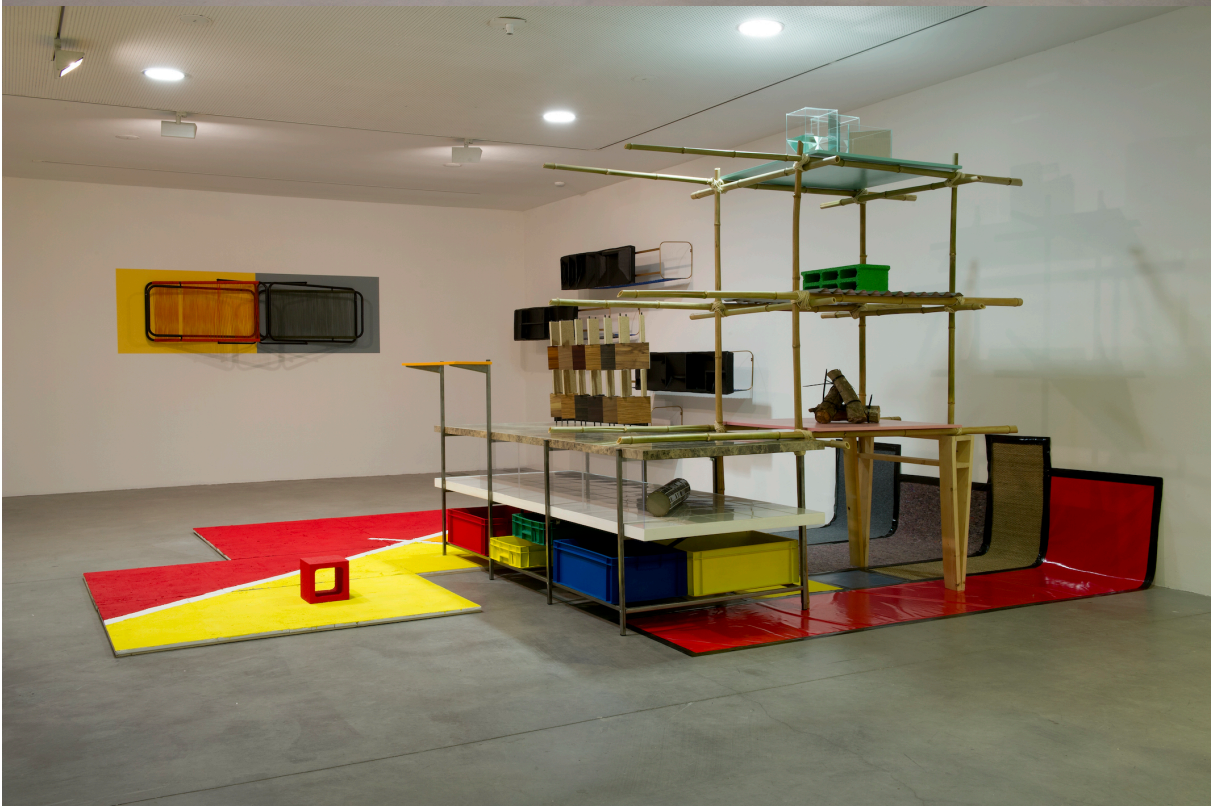
La vie héroïque de B.S. - Acte I : As a tribute... , 2013, vue de l'exposition au Frac des Pays de la Loire Matériaux divers, dimensions variables.