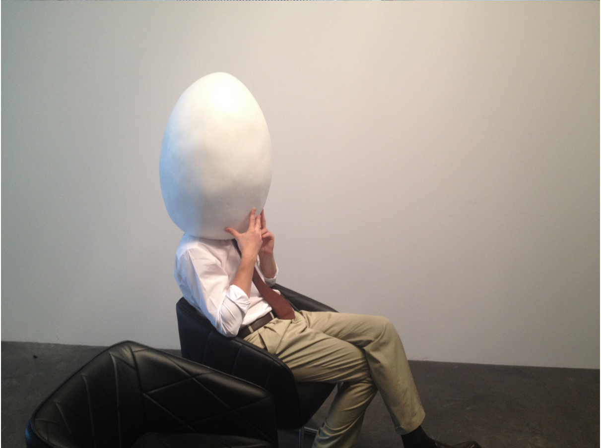
La vie héroïque de B.S. - Acte II : Le dilemme de l'œuf, vue de l'exposition à Mosquito Coast Factory et vue du tournage.